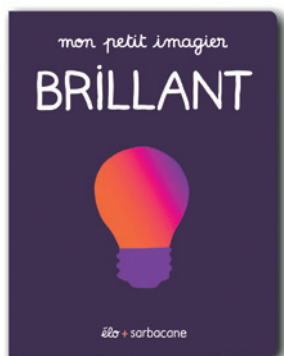
Mon petit imagier : Brillant Élo, 2023