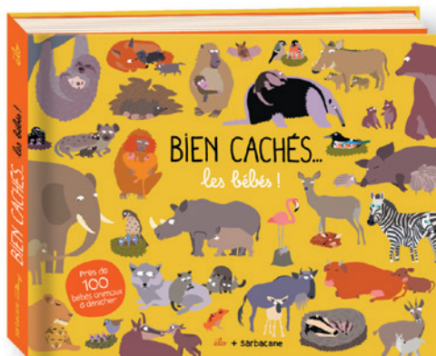
Bien cachés : Les bébés Élo, 2021