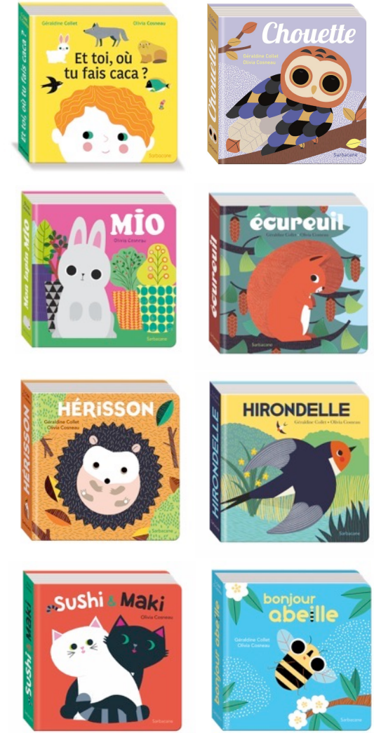
Autres titres de la collection