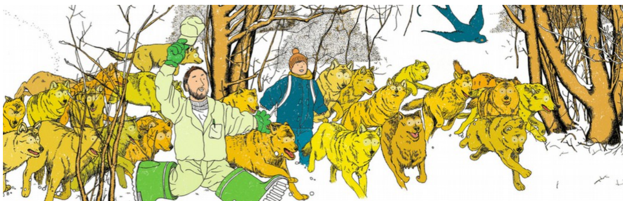
Illustration de Julien Martinière

900 € TTC sur présentation d'une facture de l'association Blaise et compagnie + frais de déplacement (pour 4, au départ de Marseille en train ou en voiture) et de restauration – et d'hébergement si besoin (2 chambres seulement)